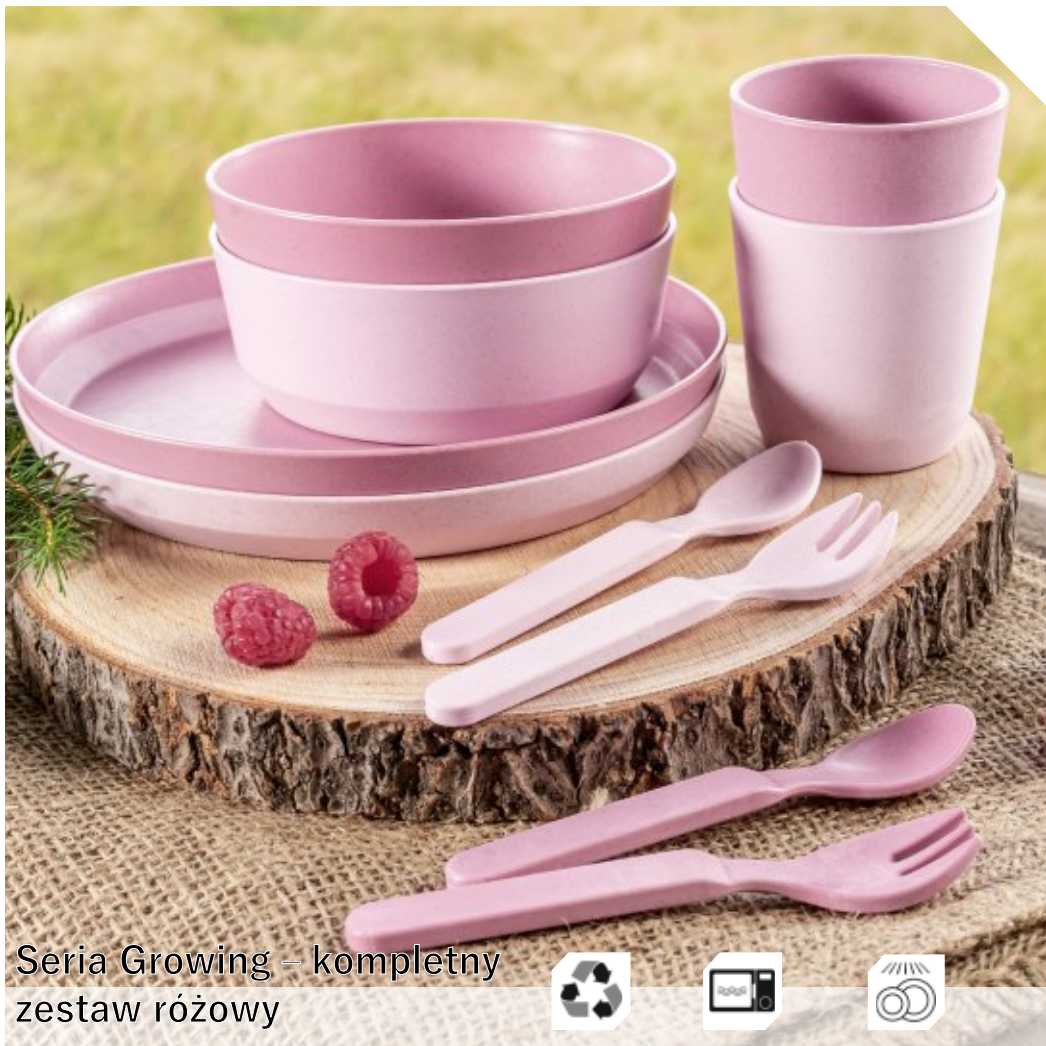
Seria Growing – kompletny zestaw różowy